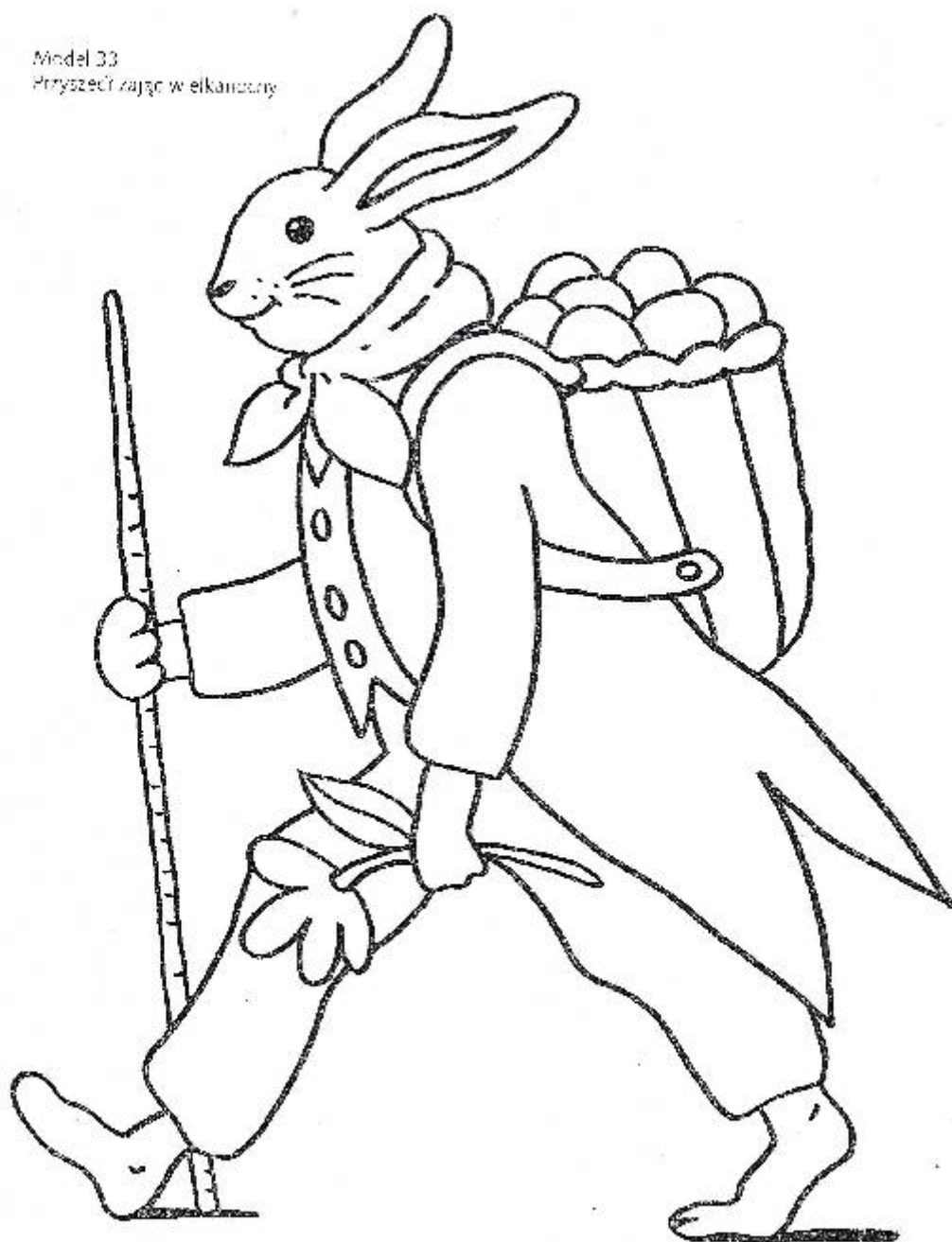
Model 33 Przyszeć zajęc w elkanosny