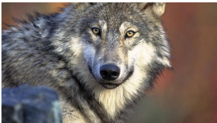
fot: trop wilka