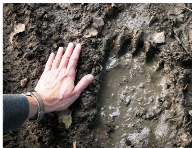
Trop niedźwiedzia w Beskidzie Małym (listopad 2012)