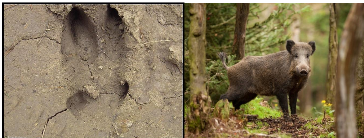
fot: trop dzika