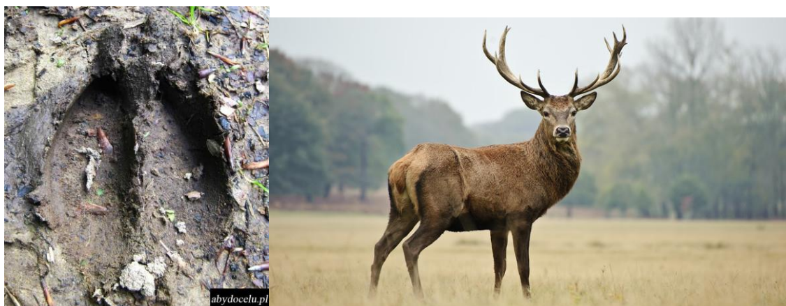
fot. trop jelenia.