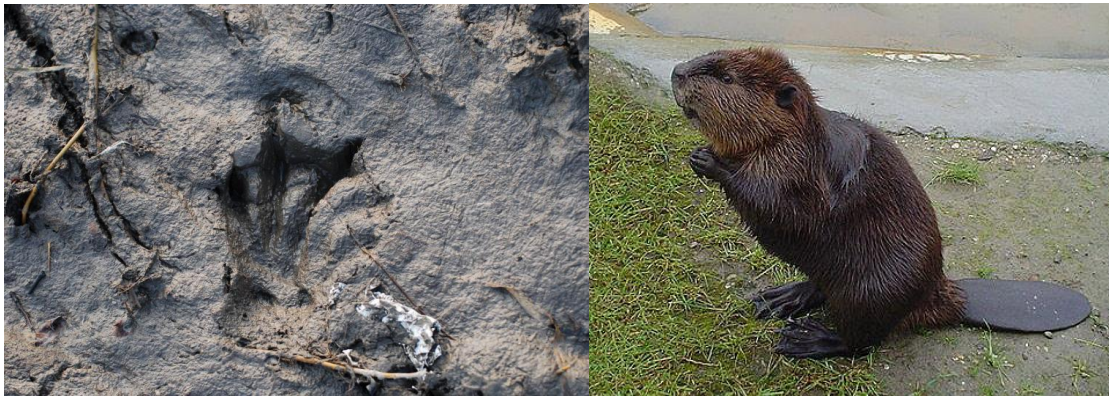
fot. trop bobra