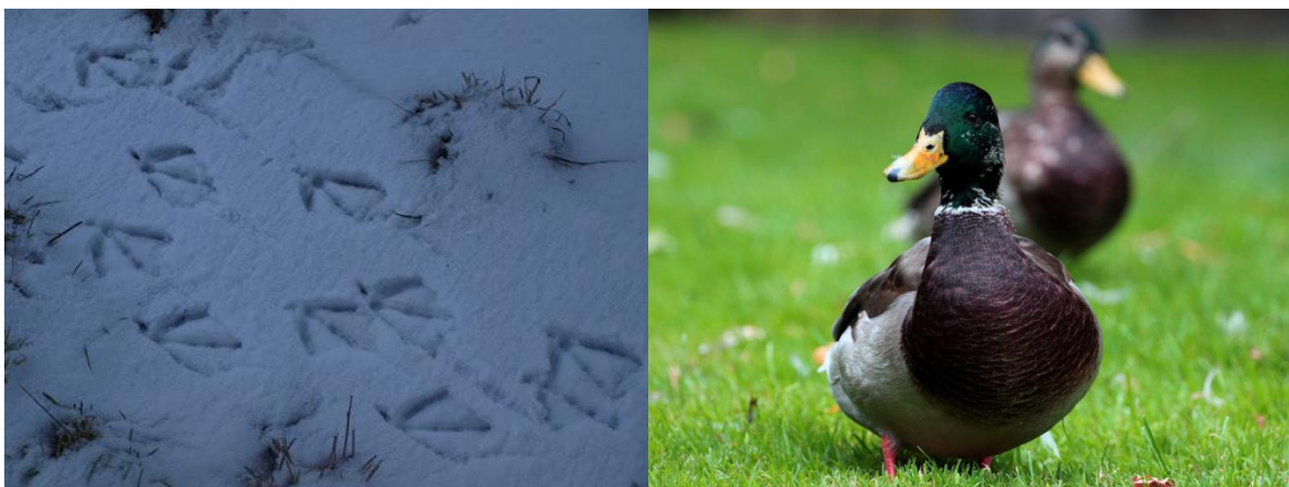
trop: kaczka krzyżówka