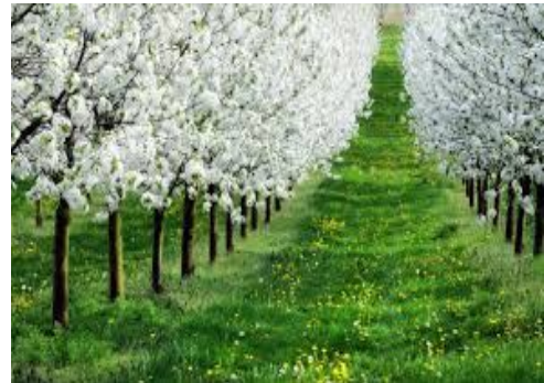
Pora roku .....